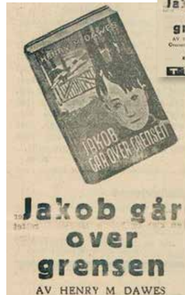
Abb. 2 Werbeanzeige (und vergrö- ßerter Ausschnitt) des Verlags Tiden Norsk forlag in der Zeitung »1ste Mai. Organ for Det norske Arbeiderparti« vom 8.12.1938, S. 5.