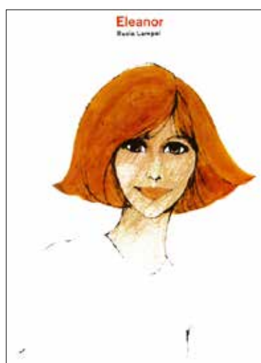
Abb. 3–4 Rusia Lampel: »Der Sommer mit Ora«. Wien: Verlag für Jugend und Volk (1964) [3. Aufl. 1966]