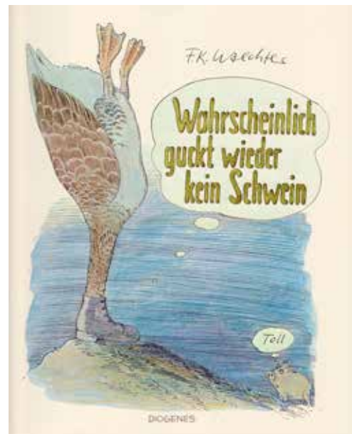
Abb. 7 F. K. Waechter (1978): Wahr-scheinlich guckt wieder kein Schwein. Zürich: Diogenes

Waechter: Ich höre das, wenn du schilderst, wie wichtig für dich Fritz und Robert Gernhardt waren, ich weiß auch, dass es vielen so ging, die Leute sind in der Regel zehn oder zwanzig Jahre älter als ich. In allen möglichen WGs lag Wahrscheinlich guckt wieder kein Schwein (1978). Ich spüre die Bedeutung des Buches und des Werkes insgesamt, aber ich fühle das nicht so.