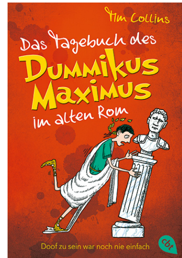
Abb. 1 Buchcover zu Das Tagebuch des Dummikus Maximus im alten Rom. Doof zu sein war noch nie einfach (2014).